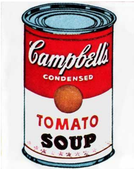
Fig. 2. Andy Warhol, "Sopa Campbells".